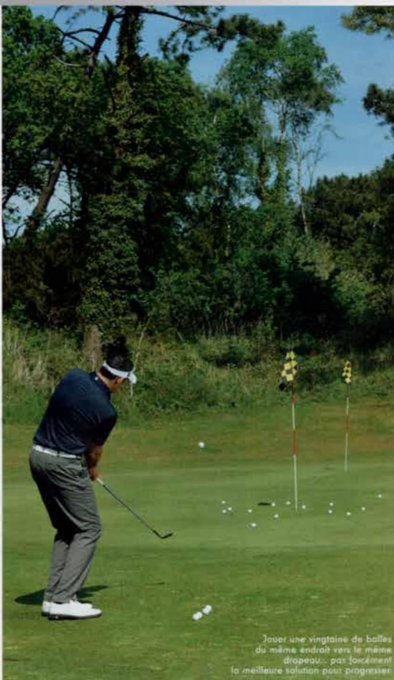
Jouer une vingtaine de balles du même endroit vers le même drapeau... pas forcément la meilleure solution pour progresser.

En réalité, sur le parcours, vous allez devoir jouer à chaque fois un coup différent avec un club différent. Par exemple, vous allez enchaîner une mise en jeu au drive avec un coup de fer effectué depuis le rough, puis une sortie de bunker et un putt de 5 mètres en descente avec une pente droite-gauche. C'est ça le vrai golf! Pour vous y préparer de la meilleure façon, vous devez vous entraîner différemment.